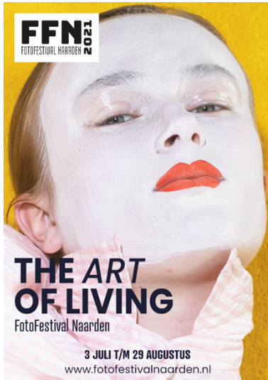
Campagnebeeld, ©Liv Liberg, Sister Sister