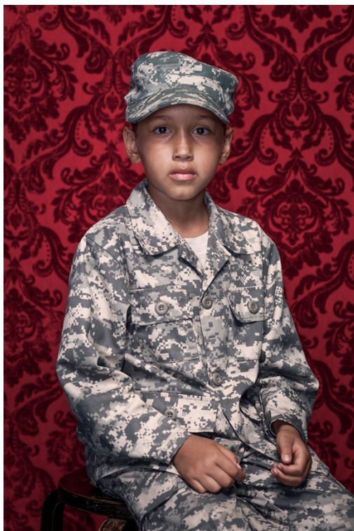
Cadets